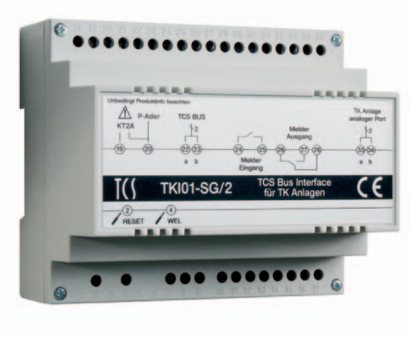
TKI01-SG/2 Arabirimi, 16 Çağrı numarasına kadar

TCS:BUS Sistemlerinin TK tesislerine bağlanması için gerekli arabirim